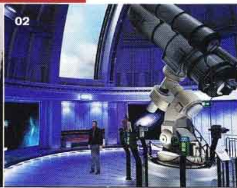
02. Špetička chodbičky a skoro stejné místnosti a pohyblivými aparáty nám daly celkem zabrat.