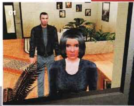
01. Zatím se jen rozkoukávejte v sousedově bytě, ale počítejte s tím, že brzo začne přituhovat.